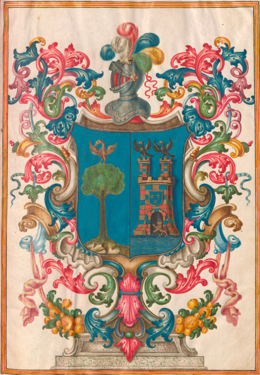
Biblioteca Museo Franz Mayer